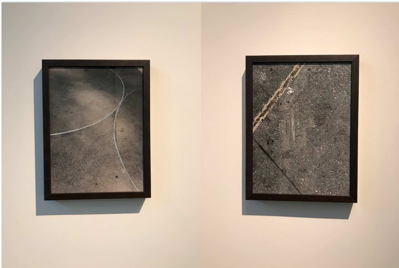
Serie Asfaltos, 2017. Fotografía digital impresión Glicée/Papel Hahnemüle Photo Rag 280 Serie de 3/3 42x30 cm.

(Guillem de Castro VLC. Five Avenue NYC. Union Square NYC)