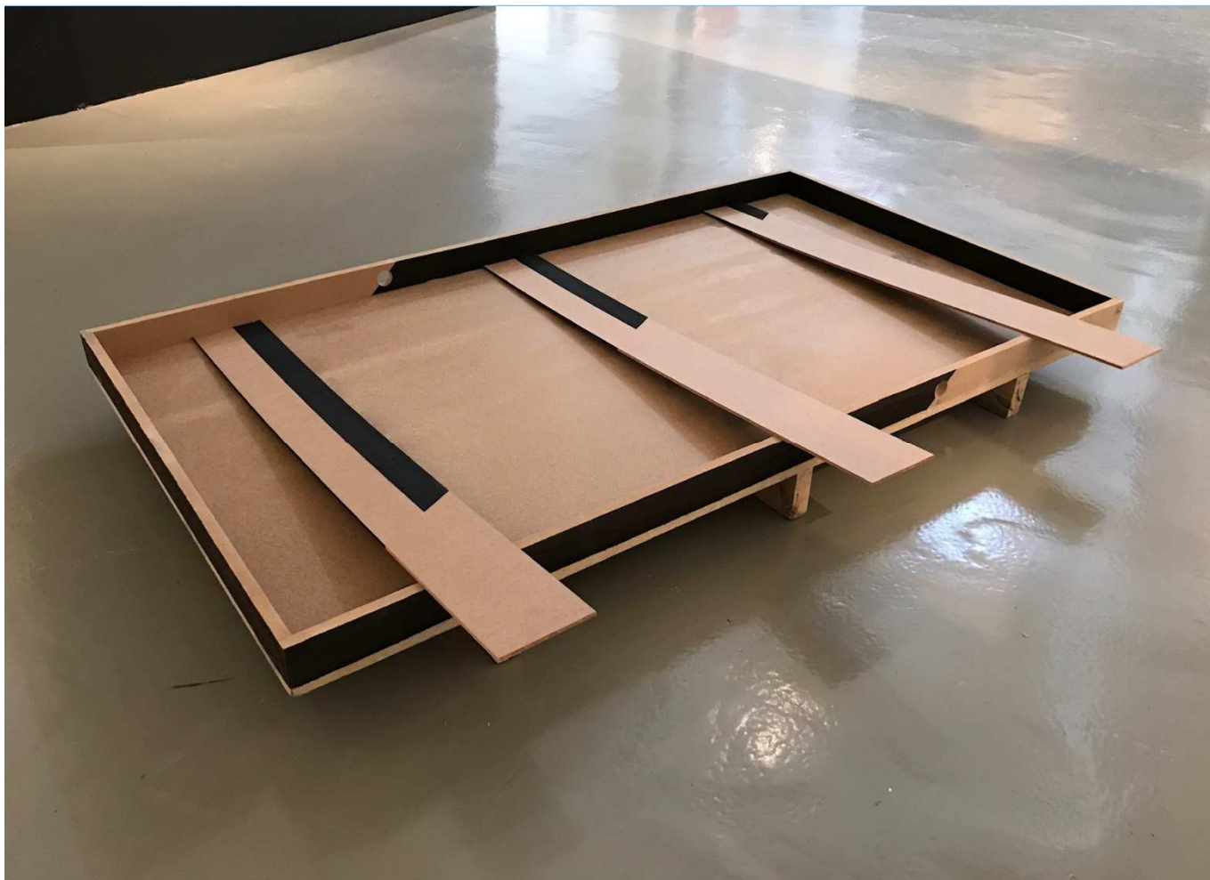
S/T (Objeto encontrado e intervenido), 2017 Madera, pintura acrílica y asfáltica. 15x170x100 cm.