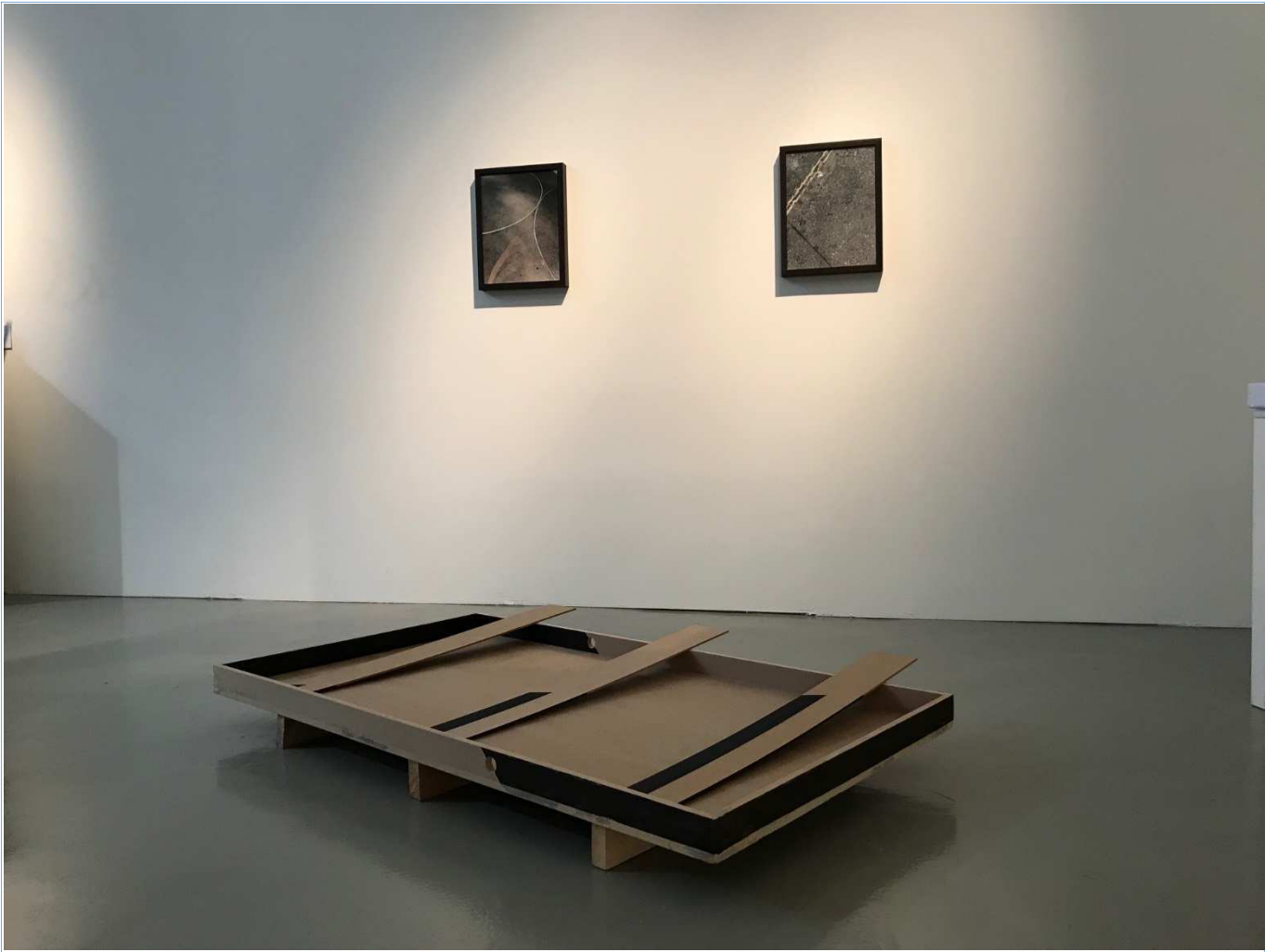
Imagen de exposición