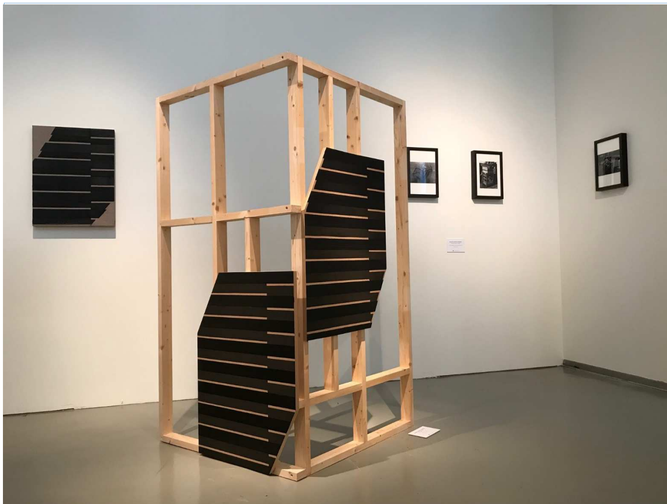
Hexagonal_I, 2017 Técnica mixta/Lino crudo (Óleo y asfáltica). 65x45 cm.