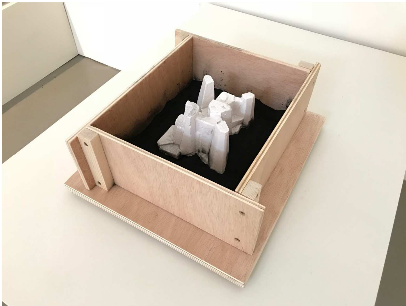
Xeros, IV (Cráter), 2018. Epoxy, madera, aluminio, pintura de poliuretano y polvo de humo (toner). 40x30x20 cm