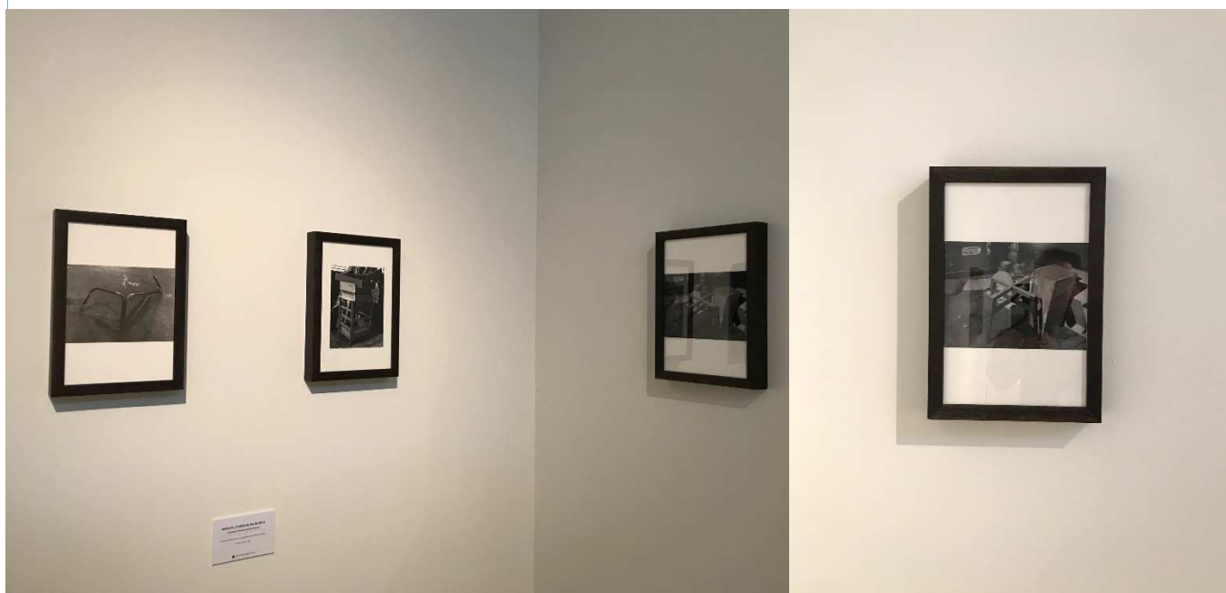
Serie Esculturas Anónimas, 2017. Fotografía digital impresión Gliclée/Papel Hahnemüle Bamboo 300 Serie de 12/3 15x21 cm (21x15 cm vert.). (diferentes localizaciones en VLC)