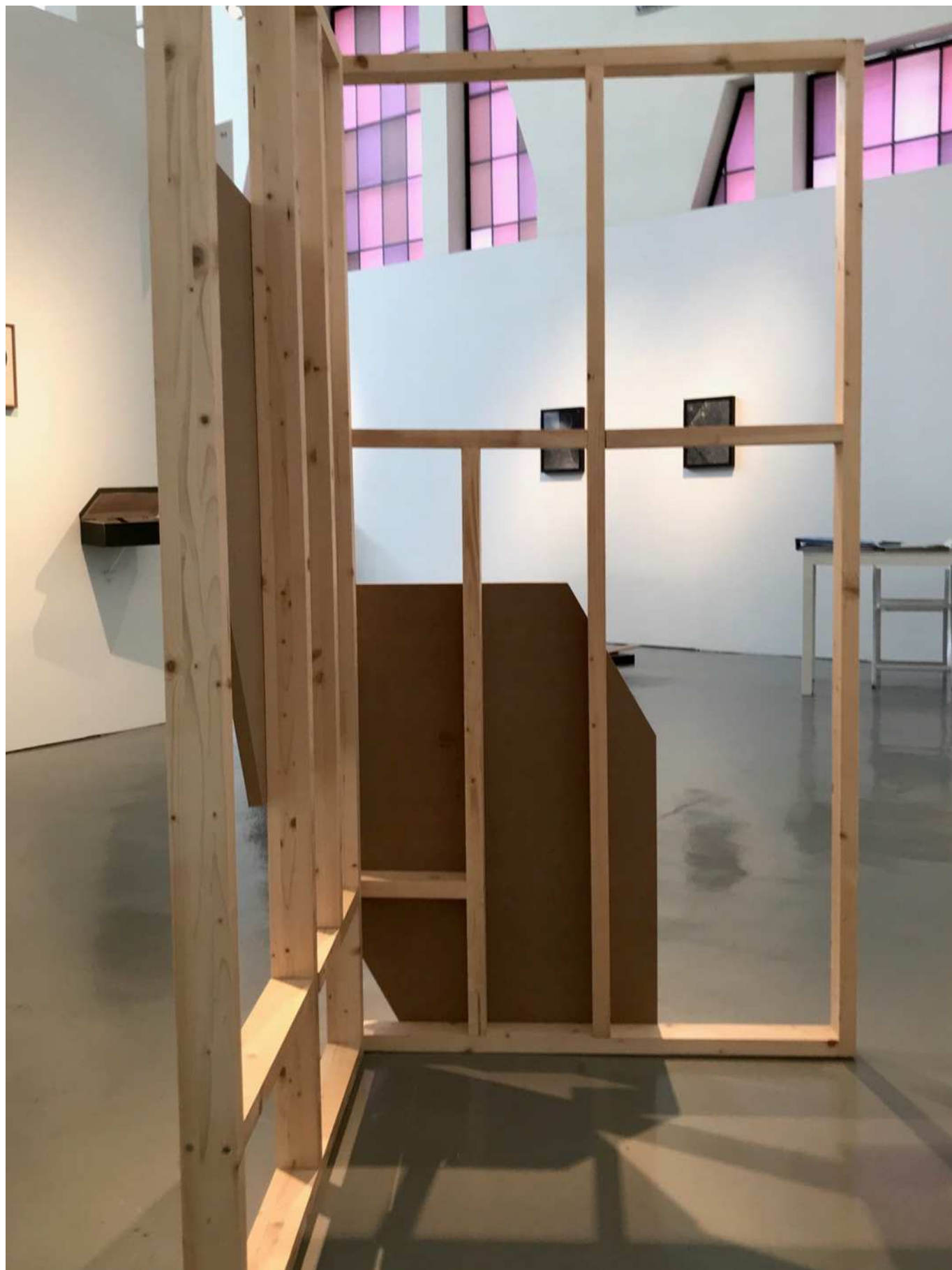
SCULTO 18 / MANUEL GAMONAL COLL BLANC ESPAI D'ART