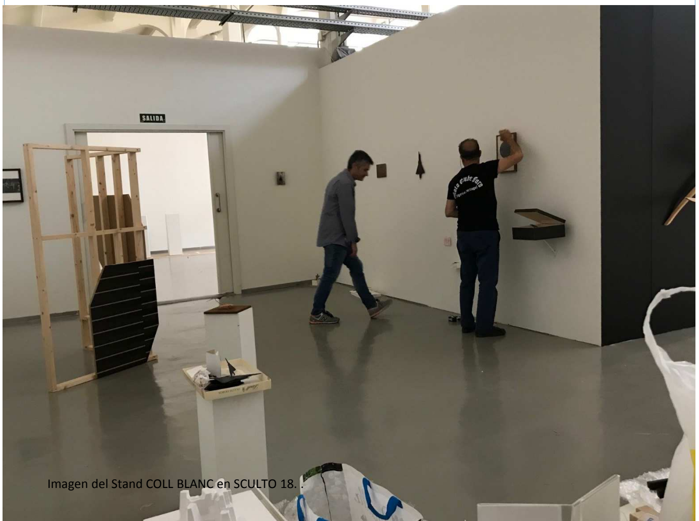
Imagen del Stand COLL BLANC en SCULTO 18.