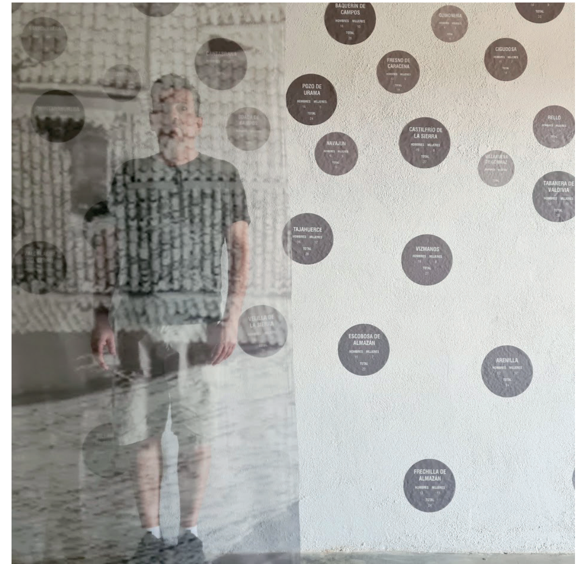
Pie de imagen

Son obras que permiten visualizar unos volúmenes que nos introducen en un espacio complejo, como corresponde a los paisajes habitados desde hace mucho tiempo. Un espacio representado mediante volúmenes llenos y vacíos, mediante superficies con texturas finas y gruesas, mediante materiales ligeros y pesados. Todo ello para acercarnos a un paisaje construido pausadamente a lo largo del tiempo, que al mismo tiempo es conocido e incluso vivido por el espectador, pero cada vez menos habitado. Ejecutados en metal, mortero y papel, materiales que nos referencian a las construcciones tradicionales, pero también a la translación de la vida desde el paisaje rural al paisaje urbano. Un paso desde la producción artesanal, herrerías, hornos de cal y batanes de papel en los talleres tradicionales, a la producción a gran escala en los talleres primero y posteriormente en las industrias urbanas.