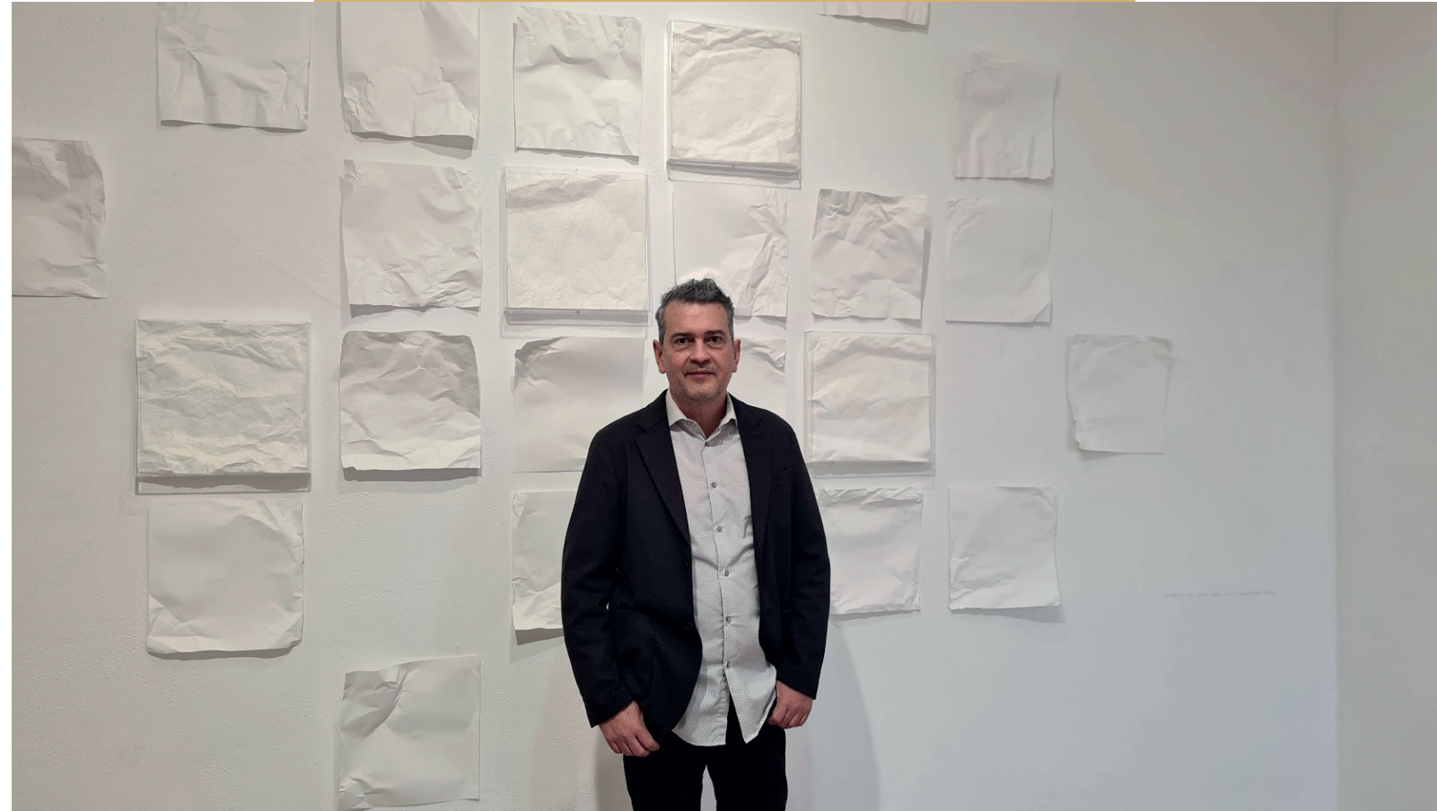
Pie de imagen