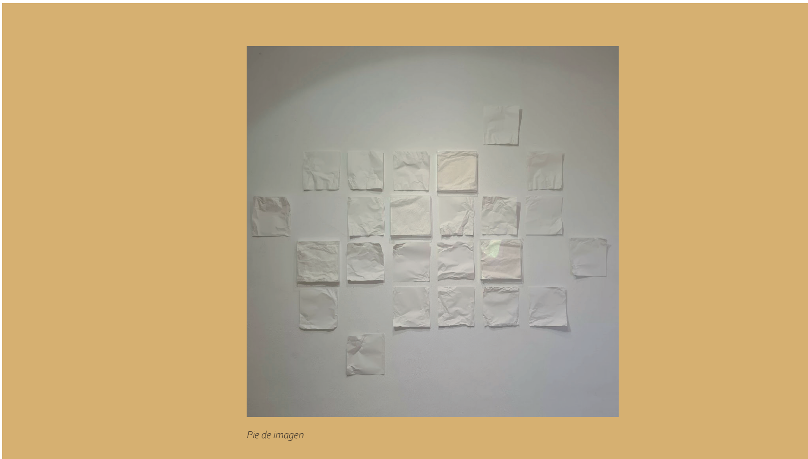
Pie de imagen

La cuarta revolución industrial ha modificado las formas de habitar y de trabajar y supone a ciudadanos, empresas y administración pública la adaptación a un continuo estado de cambio que permita prepararse para la transformación digital del mundo rural. En este contexto se puede producir un crecimiento de las desigualdades y una mayor fragmentación de la sociedad ó también puede ser un momento propicio para que se produzcan de nuevos movimientos migratorios de la sociedad urbana a la rural.