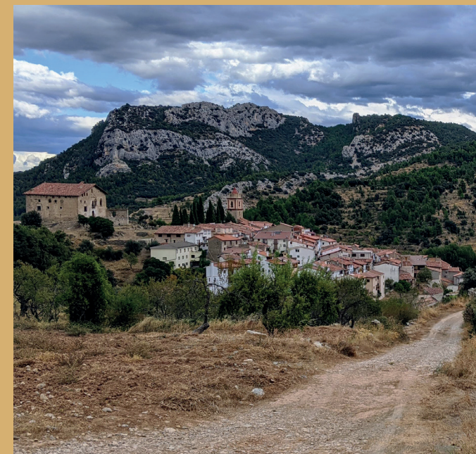
Pie de imagen