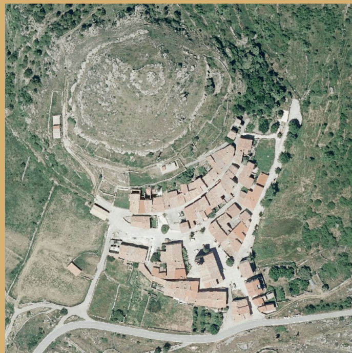
Pie de imagen