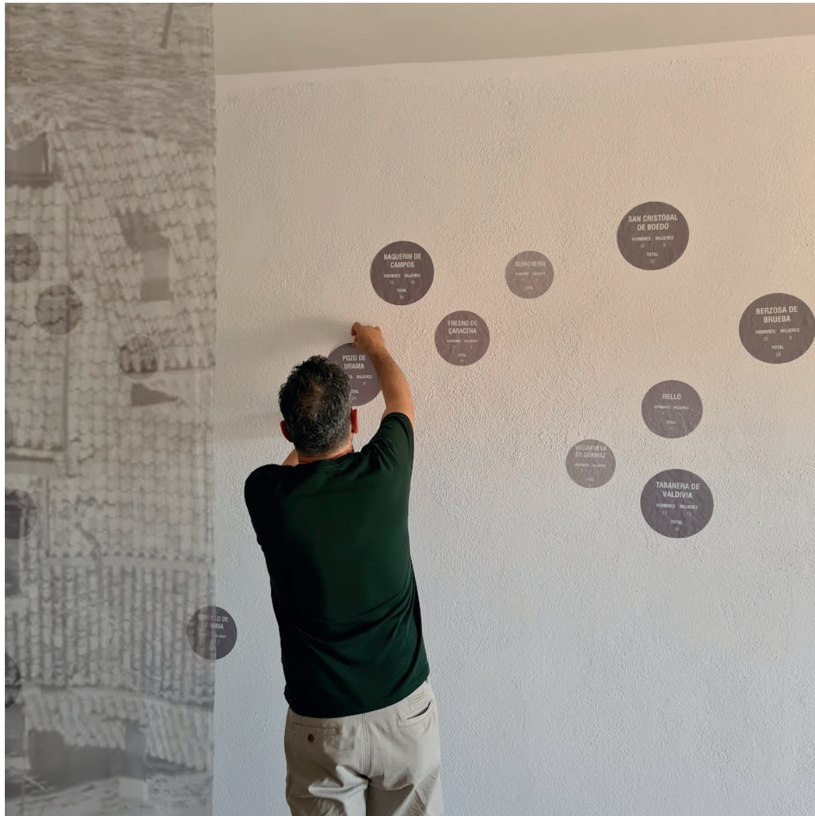
Pie de imagen